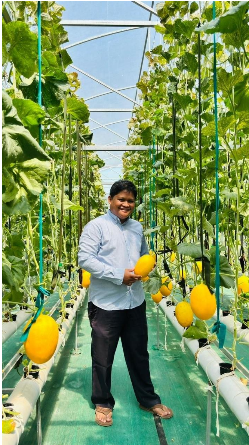
Dokumen Fisik Unit Usaha Tanjoeng Farm