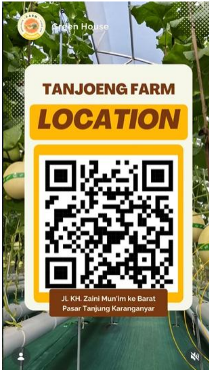
Brosur 2 Tanjung Farm